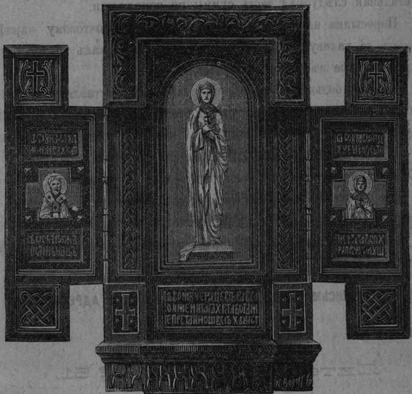
Изъ Мотивовъ Русской Архитектуры.