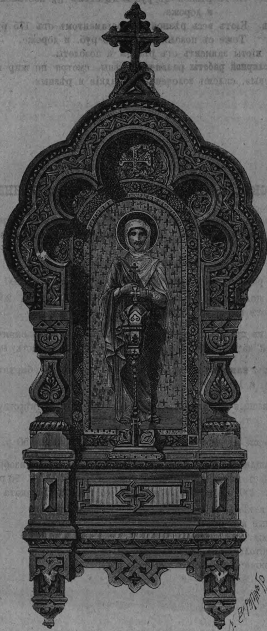
Изъ Мотивовъ Русской Архитектуры.